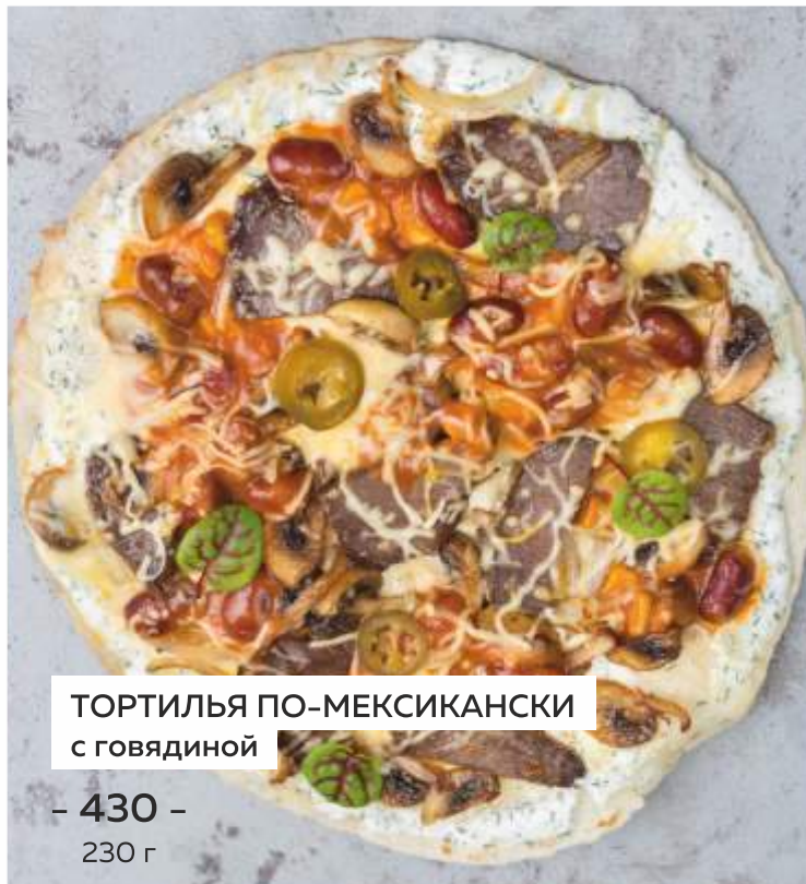
ТОРТИЛЬЯ ПО-МЕКСИКАНСКИ с говядиной