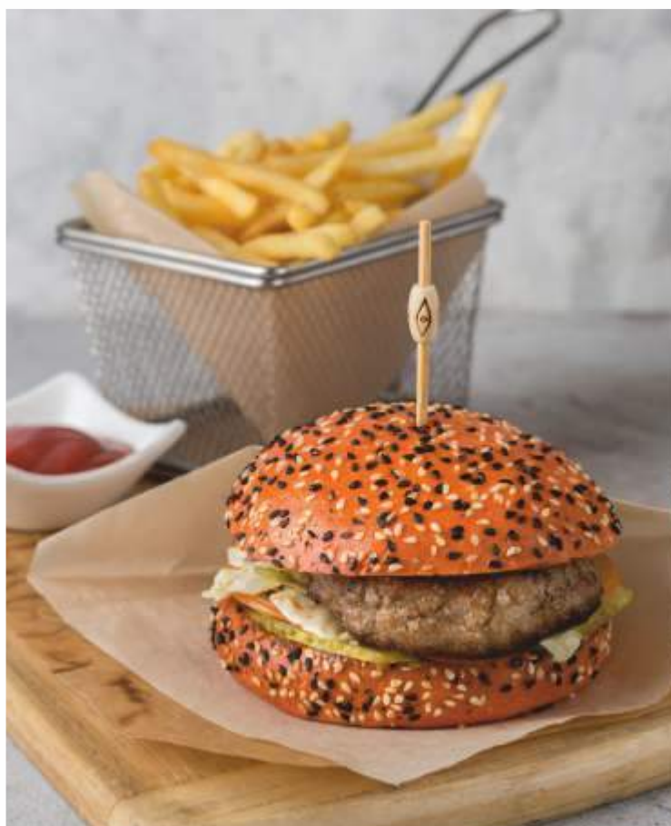
БУРГЕР ФИРМЕННЫЙ с картофелем фри