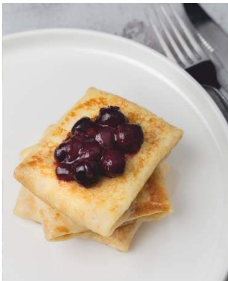
БЛИНЫ с творогом и соусом из ягод