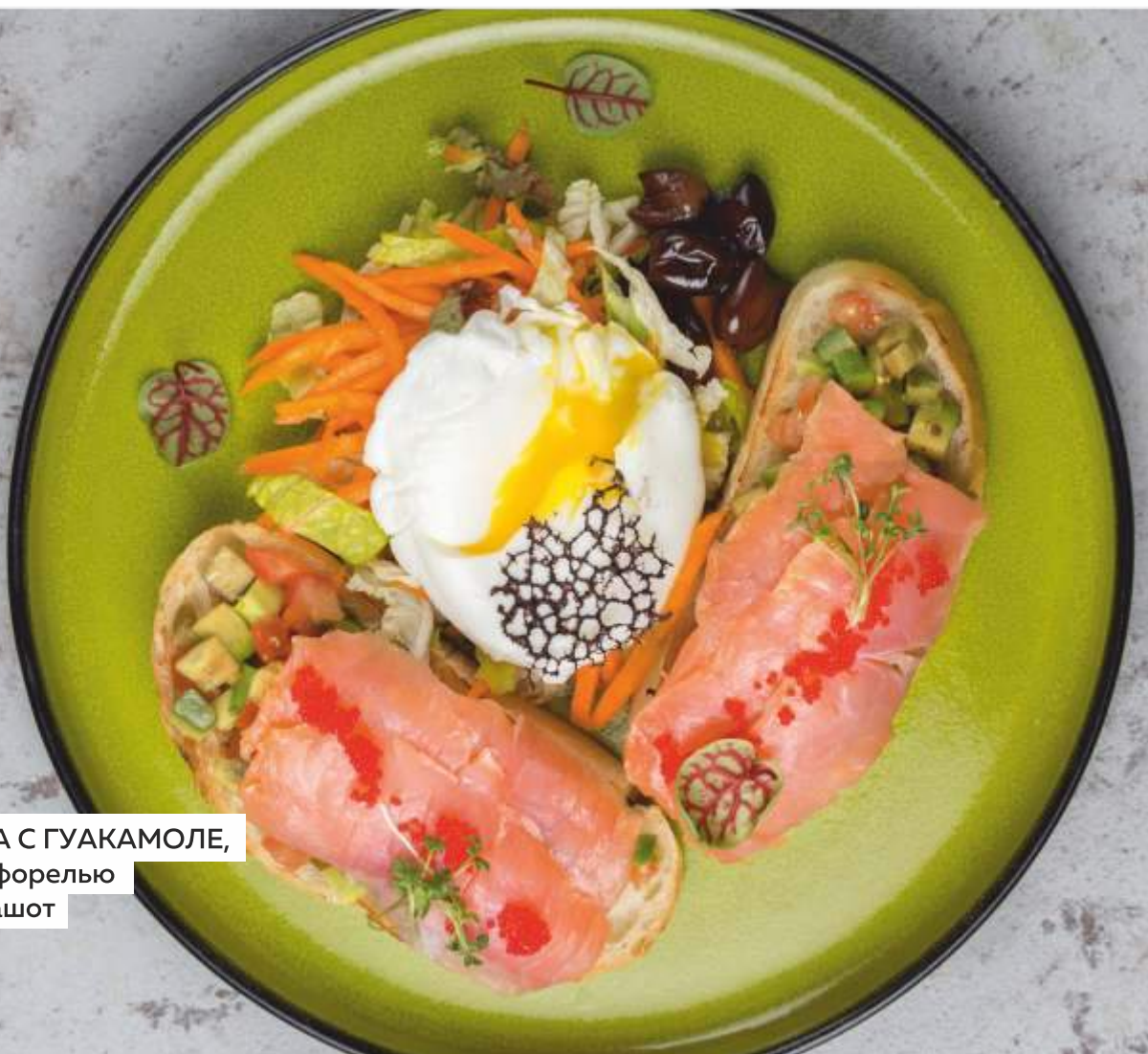
ЧИАБАТТА С ГУАКАМОЛЕ, копчёной форелью и яйцом пашот