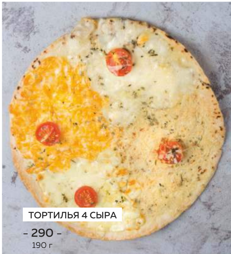
ТОРТИЛЬЯ 4 СЫРА