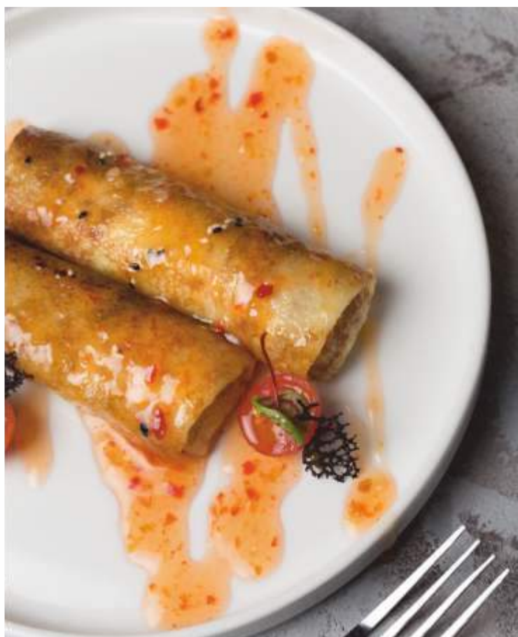
БЛИНЫ с курицей и грибами