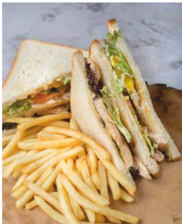
КЛАБ-СЭНДВИЧ с курицей, беконом и картофелем фри