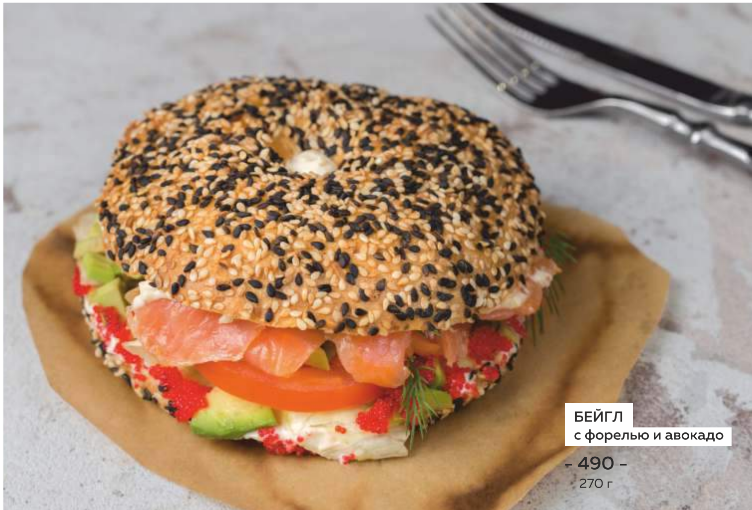
БЕЙГЛ с форелью и авокадо