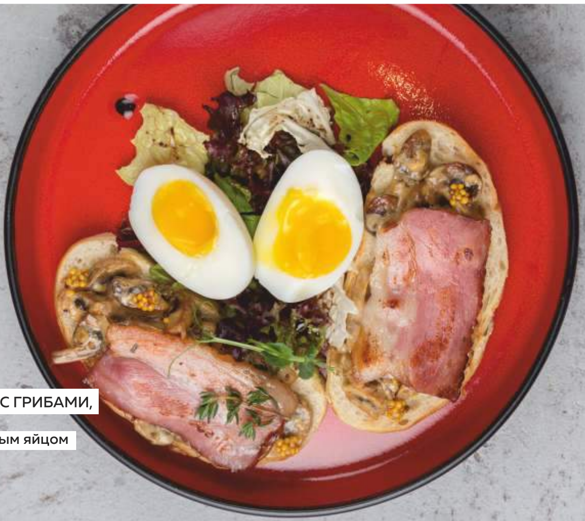
ЧИАБАТТА С ГРИБАМИ, беконом и пятиминутным яйцом